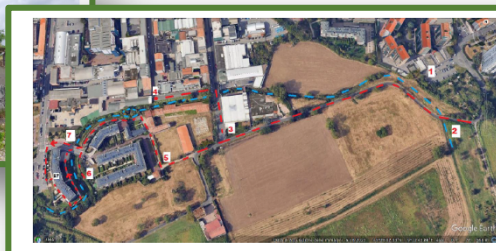
Fig. 1 – Mappa Earth con l'indicazione del tracciato del sopralluogo L'alveo della Vettabbia è indicato dalla linea blu tratteggiata)