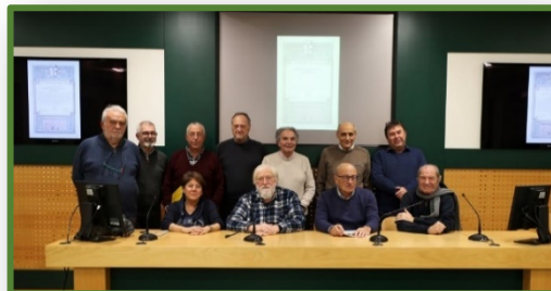
Riunione di fine anno 2023 presso Depuratore di Nosedo