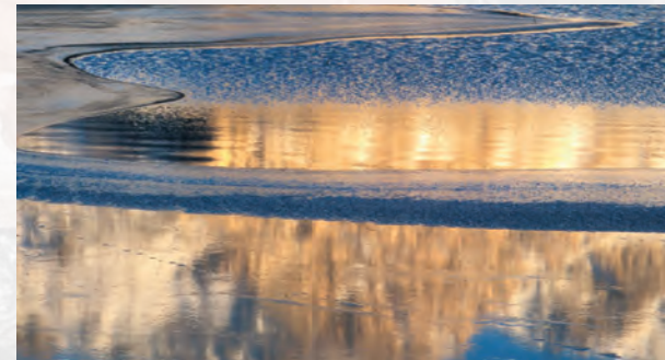
Paysage, miroir de l'âme

E' un'organizzazione internazionale che oggi conta 47 membri. Promuove la democrazia, diritti umani, l'identità culturale europea e la ricerca di soluzioni ai problemi sociali.