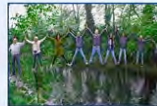
Un ponte umano sul fiume Lambro